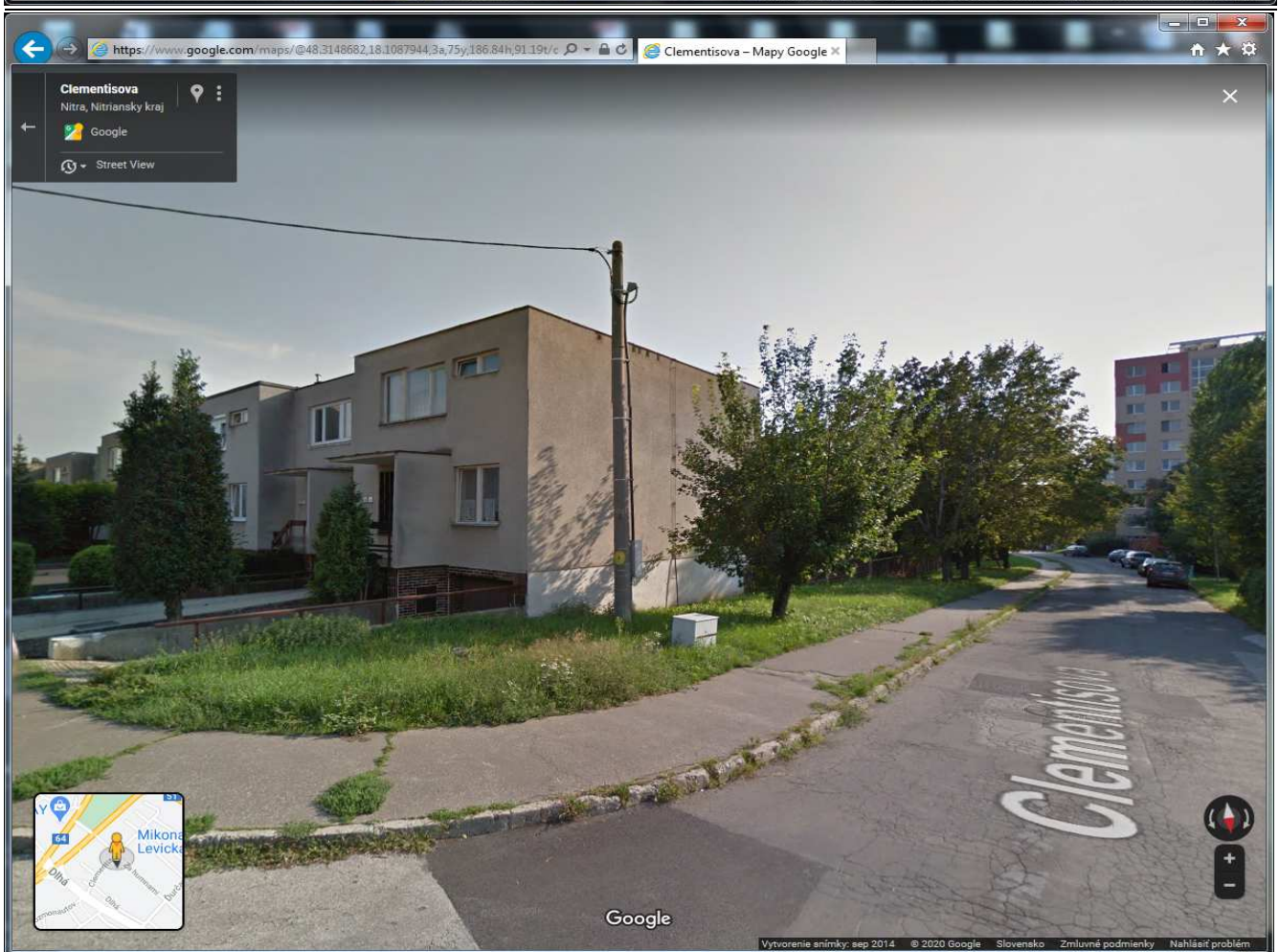
Google maps sept. 2014